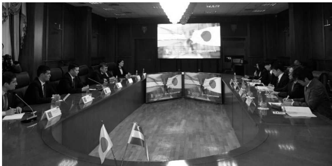
写真5 BFAとの協議の様子

財務総研国際交流課としては、これまでの26年に渡るウズベキスタン支援の歴史を大切にしつつ、ウズベキスタンが直面する課題を迅速に把握し、今後もウズベキスタン当局と緊密な連携を取りながら適切な支援を提供していきたいと考えています。今後とも日々創意工夫を重ねながら、より良い国際交流を目指して参ります。