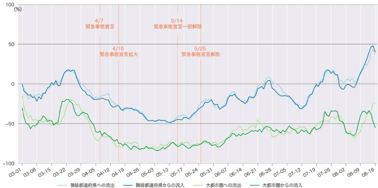
図表3 高知県における都道府県境をまたぐモビリティの変化（7日間移動平均）（月-日、2020年）