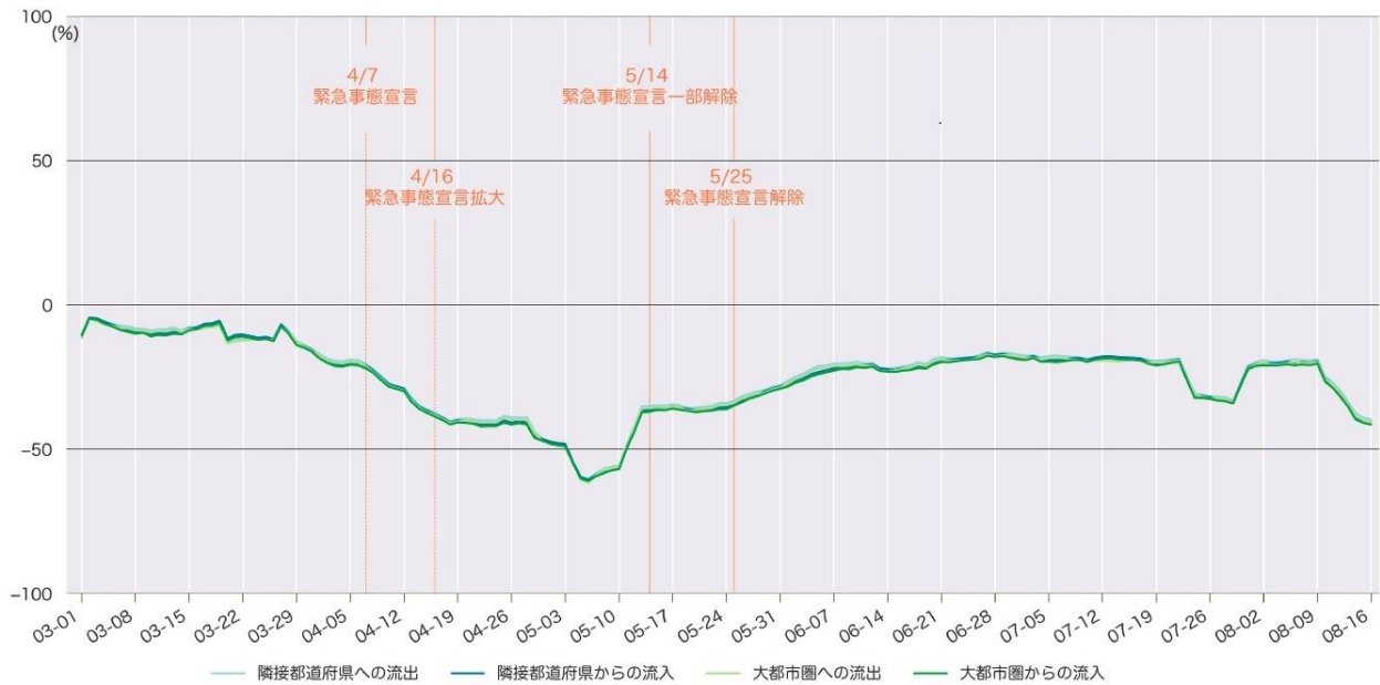
図表2 東京都における都道府県境をまたぐモビリティの変化（7日間移動平均）（月-日、2020年）