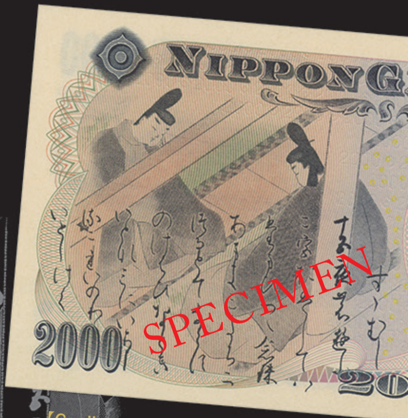
【Genji monogatari (The Tale of Genji)】 A fictional story written about 1,000 years ago.

You can get the notes at a bank or a currency exchange counter.