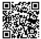
定額減税特設サイト

■定額減税の制度の詳細につきましては、国税庁ホームページ(随時最新情報に更新します。)をご覧ください。