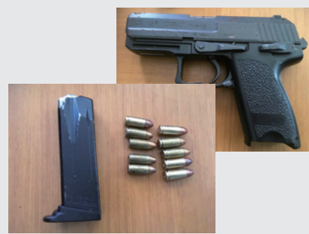
▲船の中に隠されていたけん銃