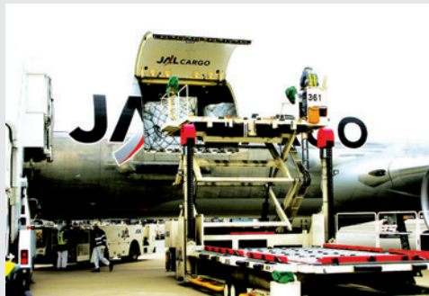
▲航空機で搬入される品物を検査します