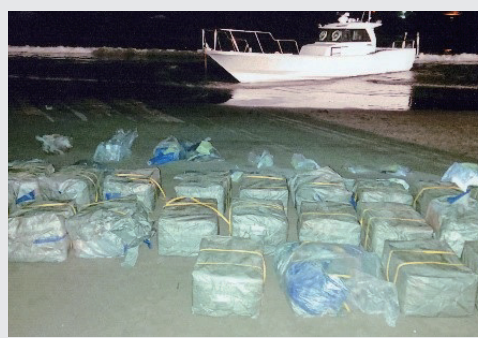
▲発見された大量の覚醒剤