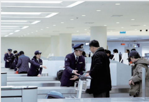
▲海外旅行の荷物を検査します