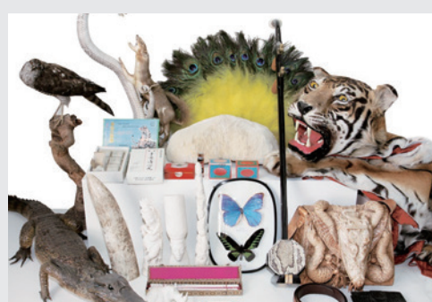
▲ワシントン条約で輸入が禁止されている動植物