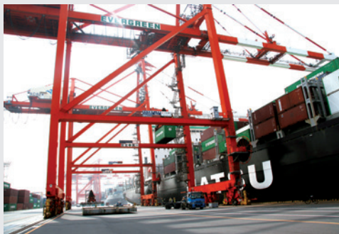
▲船舶で輸入される品物を検査します

税関の業務 税関は全国9つの地域に分けて管轄し、ルール(法律)が守られ、正しく貿易が行われるようにしています。