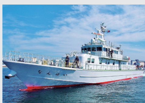
▲麻薬・けん銃の密輸入を監視する監視艇