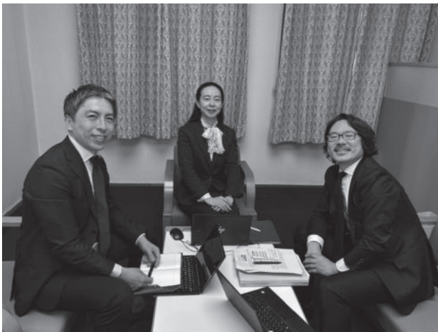
(左から、遠藤企画官、奥室長、松尾管理官)