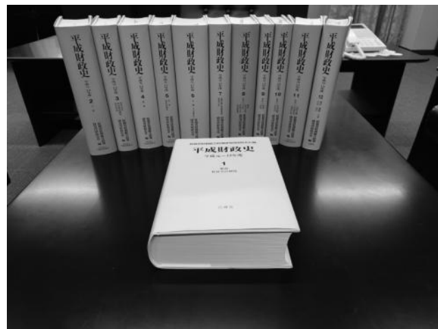
【図表3】『平成財政史—平成元～12年度』全12巻

2016年度からは東北学院大学経済学部で財政学担当の専任教員として研究教育に取り組んでいます。一年間という短い間でしたが、研究員を務めて得られた経験は、大学教員になってから研究教育だけでなく学内業務においても生かされているように思います。