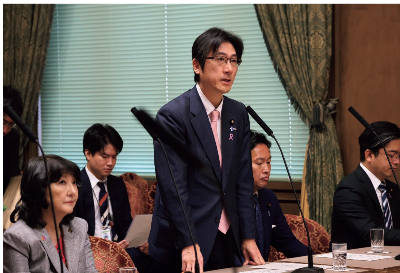
参議院財政金融委員会で発言を行う舞立副大臣（11月18日）