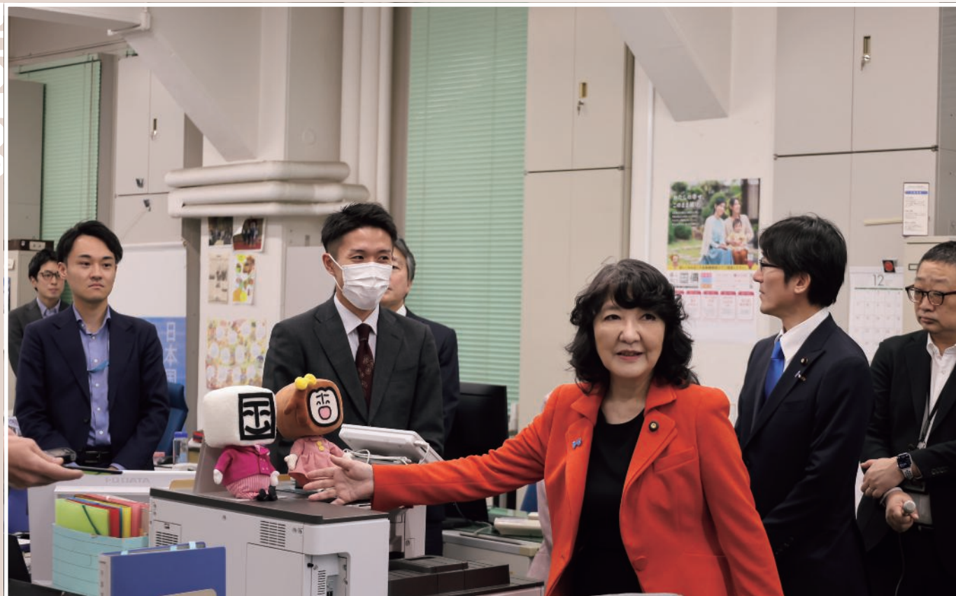
令和8年度予算編成 陣中見舞い（12月22日）