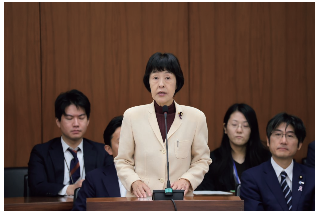
衆議院財務金融委員会で発言を行う高橋大臣政務官（11月19日）