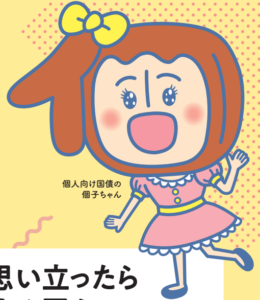
個人向け国債の 個子ちゃん