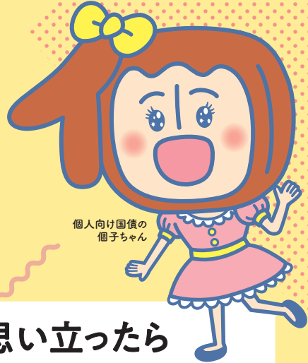
個人向け国債の 個子ちゃん