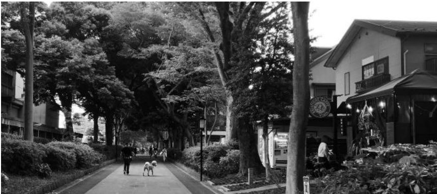
図3 歩道化された参道に沿ってオープンカフェが増えている