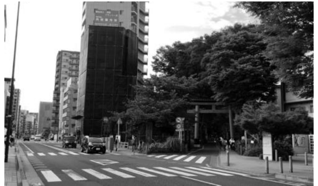
図2 中山道から分岐する氷川参道の入口と一の鳥居

線路の東側はかつて片倉製糸場だったところだ。跡地にできたコクーンシティは郊外型の大型ショッピングモールである。さいたま新都心駅を擁する駅前立地だが、国道17号バイパスだけでなく首都高速の便も