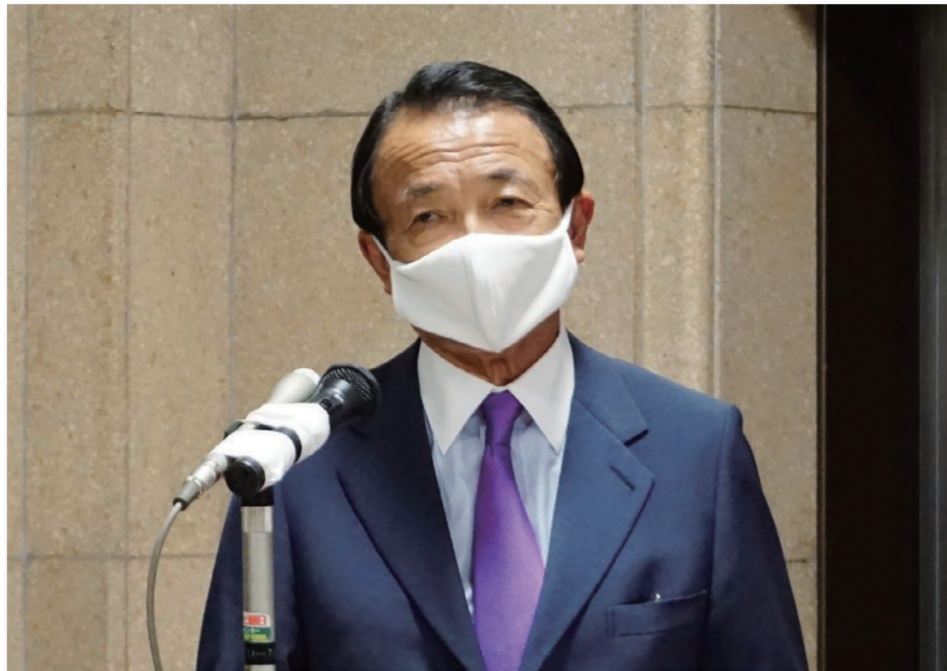
G7財務大臣電話会議後、ぶら下がり記者会見を行う麻生大臣(6月3日)