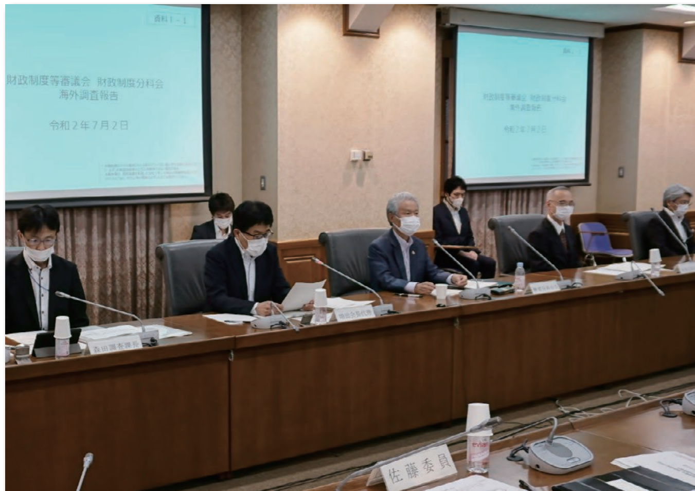
財政制度等審議会財政制度分科会(7月2日) 榑原会長(中央)、増田会長代理(左から2人目)