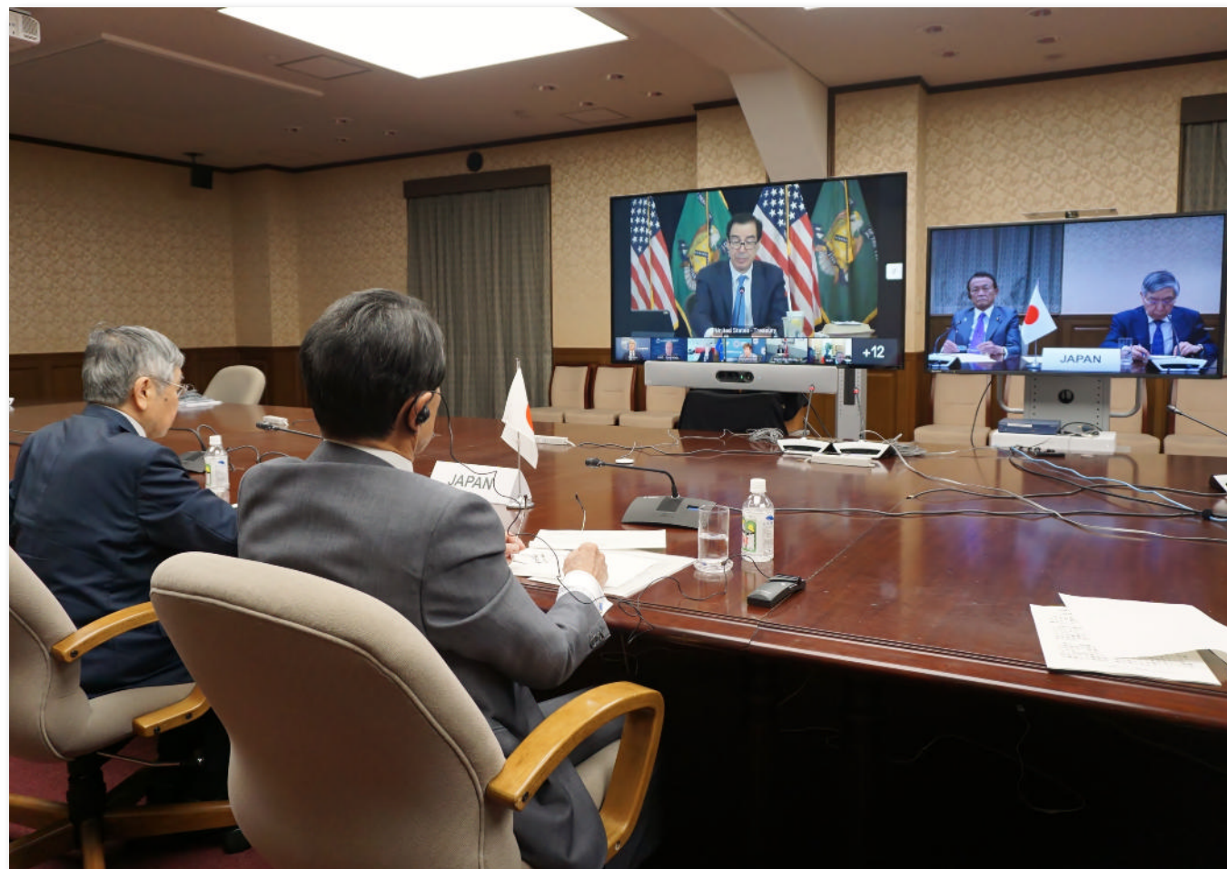
G7財務大臣・中央銀行総裁会議ビデオ会議(4月14日)