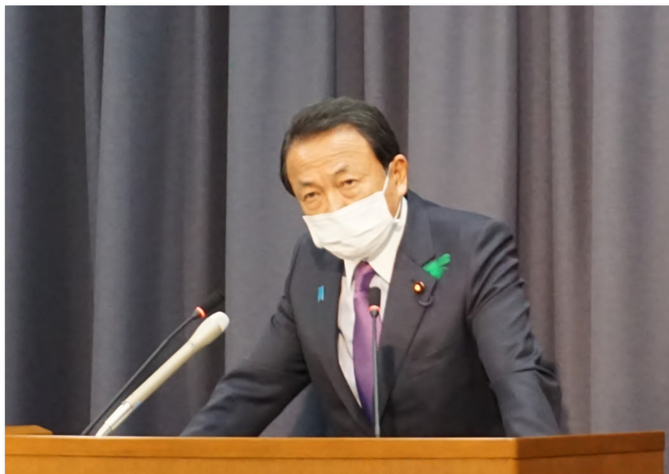
令和2年度補正予算(第一号)の概算変更の閣議決定後、記者会見する麻生大臣(4月20日)