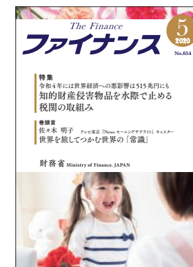
今月の表紙：ファミリー 母の日