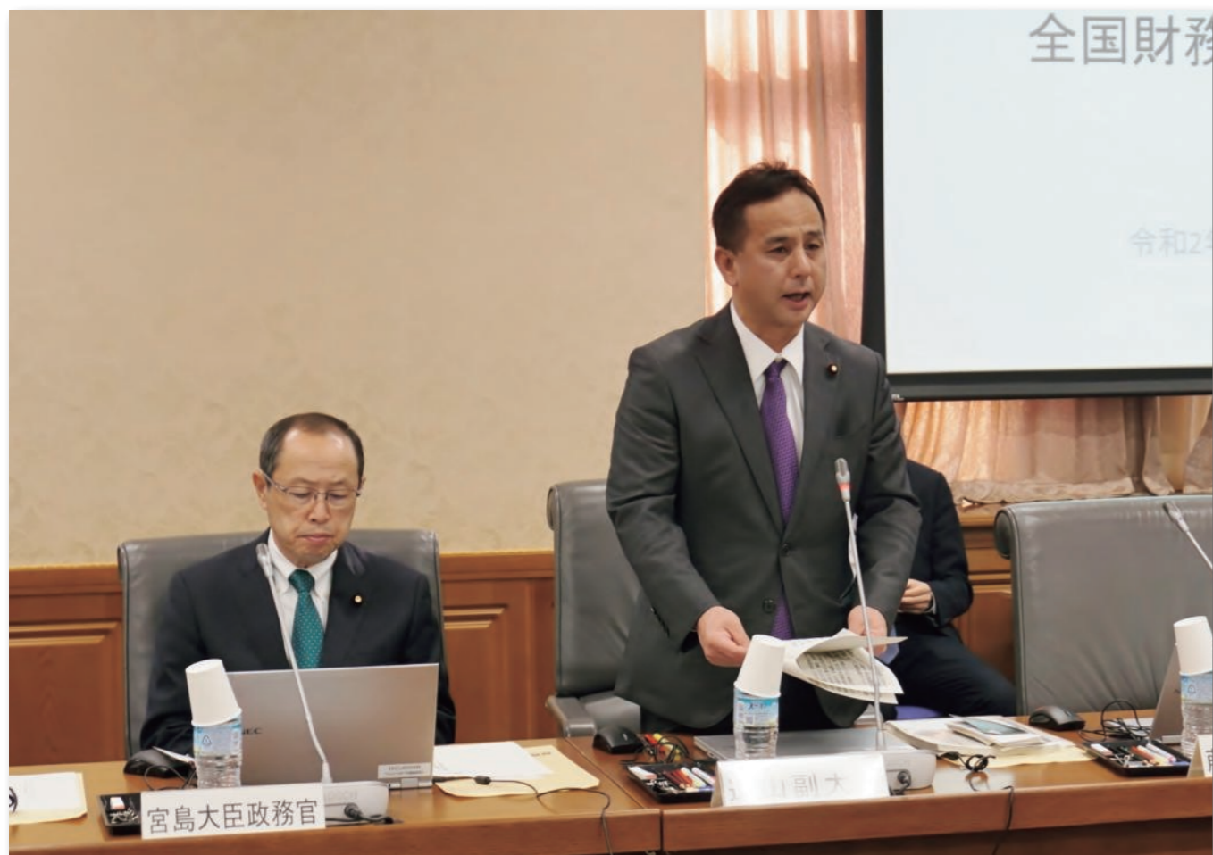
全国財務局長会議(1月30日) 遠山副大臣:右、宮島大臣政務官:左