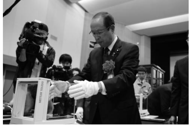
電子天秤による秤量