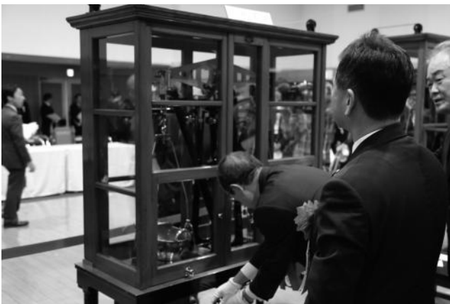
両皿天秤による秤量