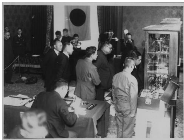
第72次製造貨幣大試験 執行官：賀屋 興宣（かや おきのり）大蔵大臣（昭和18年12月） ※当時の大試験実施場所は正廳（せいちょう、現在の大会議室）。

大試験の歴史は古く、大蔵省（現在の財務省）のもとで造幣寮（現在の造幣局）が操業を開始した翌年の明治5年（1872年）に初めて開催された。明治維新