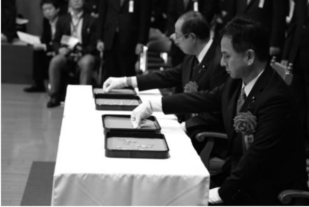
執行官による対象貨幣の選定