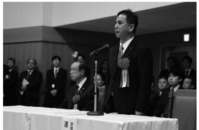
執行結果確認宣言