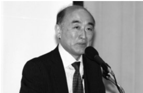
古澤満宏IMF副専務理事