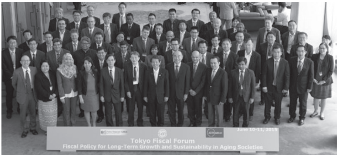
フォトセッションの様様

具体的には、アジア諸国における長期的な成長と財政の持続可能性、財政支出に関する課題として、高齢化社会における社会保障支出と公共投資支出の持続可能性、高齢化社会における歳入の課題、中央及び地方政府における財政規律と財政リスク管理について議論が行われた。