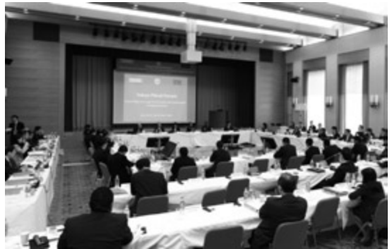
ラウンドテーブルディスカッションの様相