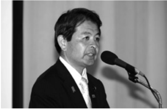
宮下一郎財務副大臣