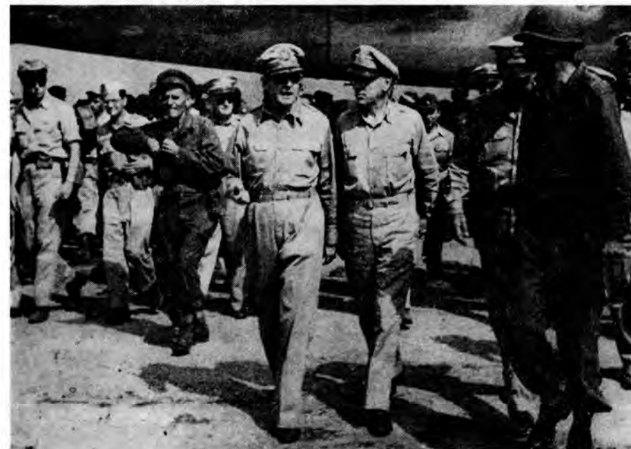
わが国に第1歩を印したマッカーサー連合国軍総司令官

政府は占領軍の日本到着前に、マニラの総司令部に、占領軍が日銀券を使用するようにとの要請を出し、日銀とも連絡して10億円限度の提供の準備をした。ところが、米軍には8月末までに円表示軍票が支給されていた。9月2日の日本の降伏文書署名直後に発表された連合国軍総司令部の日本占領方針とともに、第1号