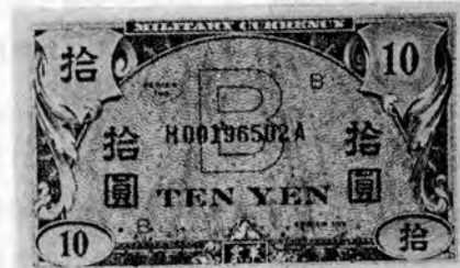
占領軍の準備した軍票