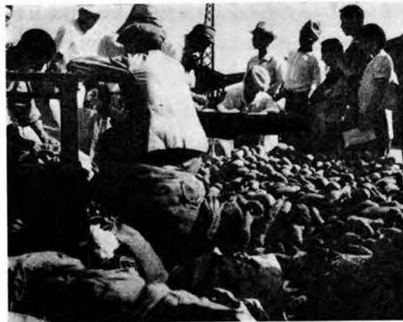
食糧買出し取締りの現場