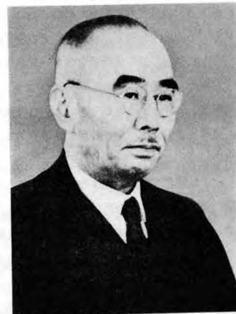
第54代大蔵大臣 石橋湛山

20年11月16日に「戦時利得の排除及び国家財政の再建に関する件」の司令部覚書が出た。戦争によっては何者も利得を得てはならぬとの思想で、戦時利潤の回収と累進課税の強化とが指示された。大蔵省が法人の戦時利得を課税の対象と考えたのに対して、覚書では、法人のすべての利潤を吸収しようとしたものであった。この司令部の指示を大蔵大臣の発想による覚書であるという形式をとって、その提出に対して司令部が了解を与えたという形式にし、さらにこの覚書による法案の形式で年末に司令部に報告して、その内容を21年1月10日に要綱として発表した。そしてこの線に沿って、2月16日に臨時財産調査令（緊急勅令第85号）を公布し、預金の封鎖を実施した。預金の封鎖には他の目的もあったが、財産税に関するかぎりは動産課税の一手段であり、この方法のために、別途新円の発行による通貨の切替えで、預金引出しによる封鎖回避の道を絶ったのであった。