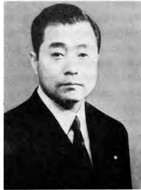
第53代大蔵大臣 伊沢敬三

21年9月に改定予算が成立して、財政運営はようやく軌道に乗ったが、改定予算当初計画約320億円の規模は、終戦処理費191億円等の計上で561億円に増大し、租税等の経常財源が不足したので、財産税収入を一般財源に繰り込むことで収支のつじつまが合わされる結果となった。21年度予算には、20年度中の駐留費の日銀立替払いの返済も計上された。