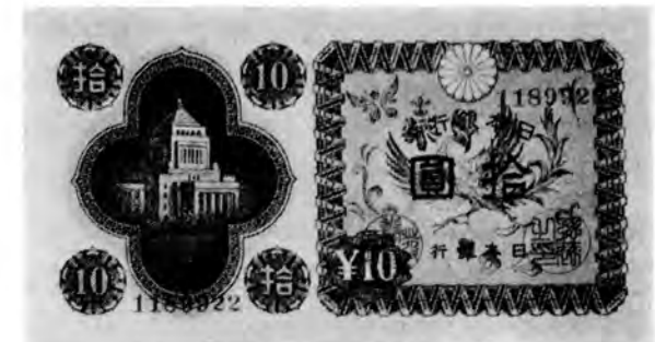
いわゆる新円の日銀券10円、表

食糧不足に対して、政府は供出促進を図るとともに、司令部に対して食糧援助を要請したが、通貨急増に対しては購買力の抑制策が検討され、これらが預金封鎖、新物価体系、新円経済、500円生活の構想へと固まっていた。この預金封鎖についても、前述のように、半永久的な凍結を予定したものではなく、総合対策の効