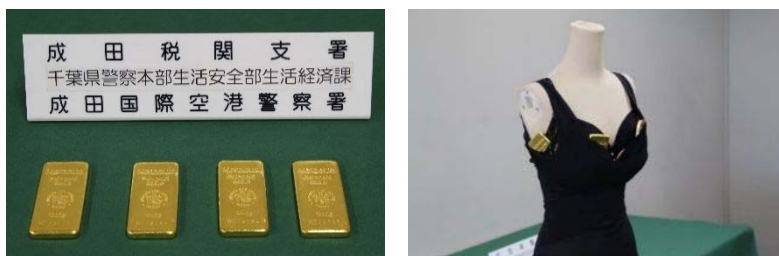
○ブラジャー内に隠匿

犯則者 B が台湾から入国する際に、金地金 4 kg を身辺に隠匿し、税関長の許可を受けることなく輸入しようとし、消費税等約 140 万円を不正に免れようとした事案について、共犯者も含め告発しました。