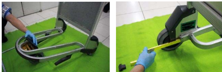
○手荷物カートに工作隠匿

犯則者 A が韓国から入国する際に、金地金約 9.5kg を手荷物カート内に隠匿し、税関長の許可を受けることなく輸入しようとし、消費税等約 483 万円を不正に免れようとした事案を告発しました。