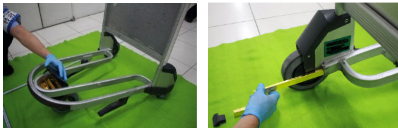
○手荷物カートに工作隠匿

犯則者Aが韓国から入国する際に、金地金約 9.5kg を手荷物カート内に隠匿し、税関長の許可を受けることなく輸入しようとし、消費税等約 483 万円を不正に免れようとした事案を告発しました。