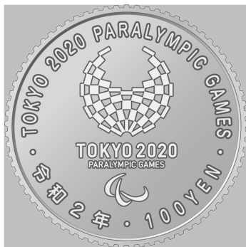
原寸 2 倍