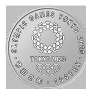
原寸 (直径 22.6 mm)