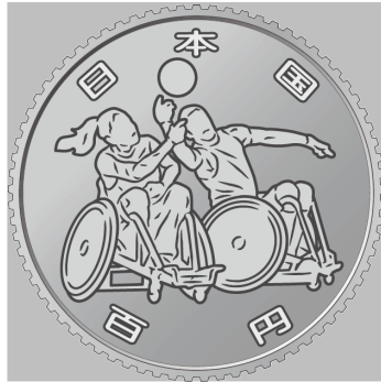
原寸 2 倍