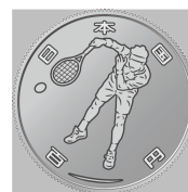
原寸 (直径 22.6 mm)