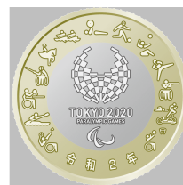
原寸 (直径 26.5 mm)