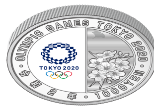
裏面（下方方向に傾けたもの）