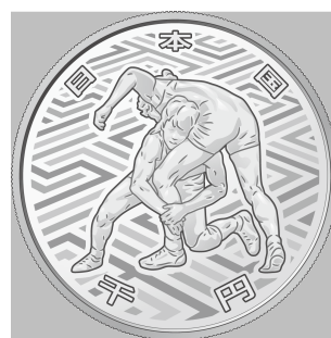
原寸 (直径 40 mm)