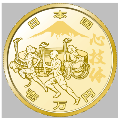
原寸 2 倍