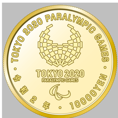
原寸 2 倍