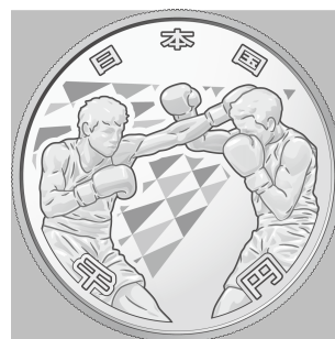
原寸 (直径 40 mm)