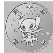
原寸 (直径 22.6 mm)