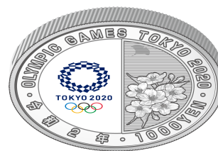
裏面（下方方向に傾けたもの）