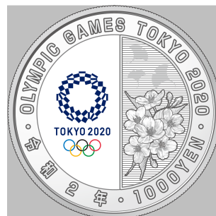
原寸 (直径 40 mm)