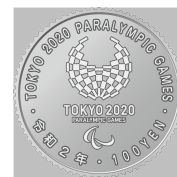
原寸 (直径 22.6 mm)