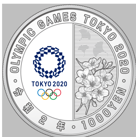
原寸 1.5 倍