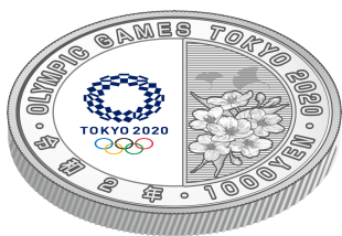
裏面（上方方向に傾けたもの）