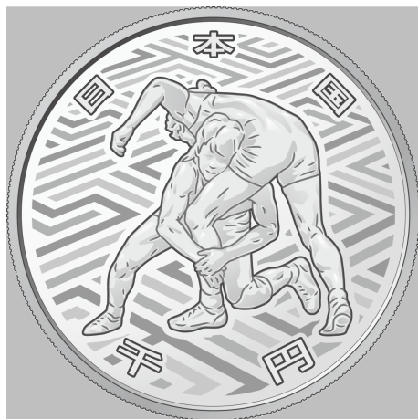
原寸 1.5 倍