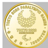
原寸 (直径 26 mm)