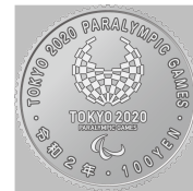
原寸 (直径 22.6 mm)