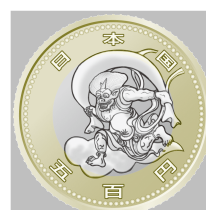
原寸 (直径 26.5 mm)