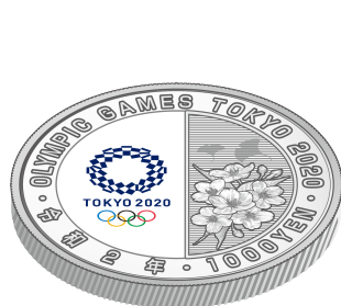
裏面（上方方向に傾けたもの）