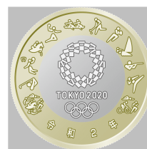
原寸 (直径 26.5 mm)

○ 東京2020オリンピック競技大会エンブレムの周囲に、近代五種、ゴルフ、バスケットボール、馬術、ハンドボール、ボート、ホッケー、ラグビー、セーリング、射撃、テコンドー、トライアスロンに関する東京2020オリンピックスポーツピクトグラムを配しています。