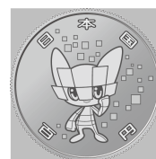
原寸 (直径 22.6 mm)