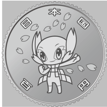
原寸 2 倍