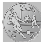
原寸 (直径 22.6 mm)