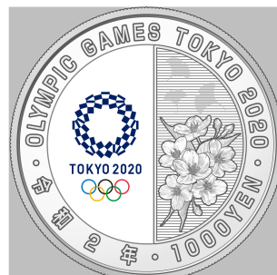
原寸 (直径 40 mm)