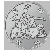
原寸 (直径 22.6 mm)