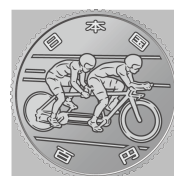
原寸 (直径 22.6 mm)