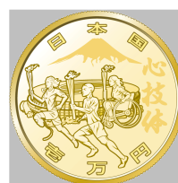
原寸 (直径 26 mm)