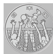
原寸 (直径 22.6 mm)