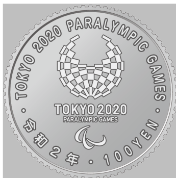
原寸 2 倍