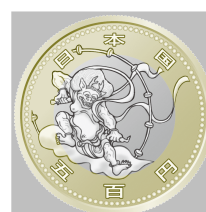
原寸 (直径 26.5 mm)