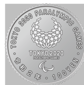
原寸 (直径 22.6 mm)