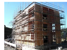
CLT(直交集成板)を用いた建築物の実証