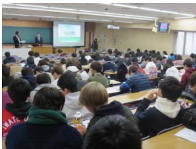
岩手大学での講義の様相