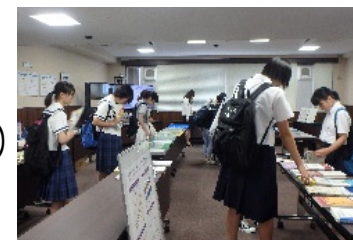
オープンキャンパスの様相