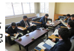
久米南町への提案

○PTは、地方公共団体の特性を踏まえたうえで、町外から見た気づきという観点を持ちながら方策を検討し、「特産品や6次産品の認知度向上・販路拡大」、「外国人観光客を呼び込むための地域資源の活用や体験イベントの実施」等に係る方策を地方公共団体へ提案。