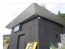
空き家を改装した カフェ

●矢掛町は、古民家再生による街並みの景観保持や観光振興を通じた地域活性化に取り組んでいる。