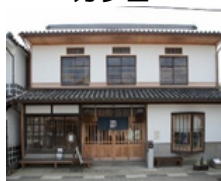
古民家を改装した 交流館

○PTは、地方創生総合戦略の推進、地方公共団体が抱える6次産業化や観光等に関する課題の解決に向けた方策の検討を重ね、平成30年2月に、久米南町、矢掛町を再度訪問し、方策を提案。