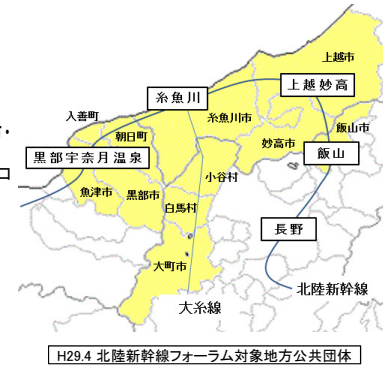
H29.4 北陸新幹線フォーラム対象地方公共団体