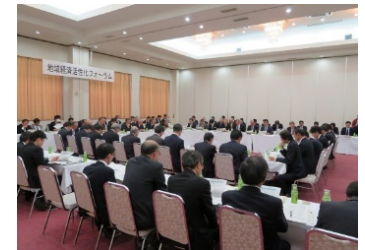
フォーラムの様相(H28.11那須烏山市)