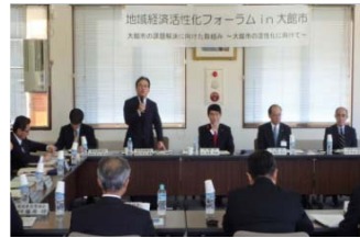
地域経済活性化フォーラム in大館市(27年10月14日)