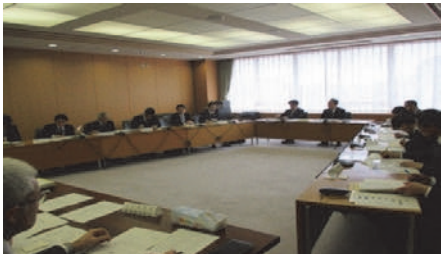
金融・経済勉強会の模様