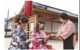
地域住民ボランティアの茶屋 「おすそわけ茶屋」