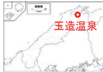
多様な関係者との連携