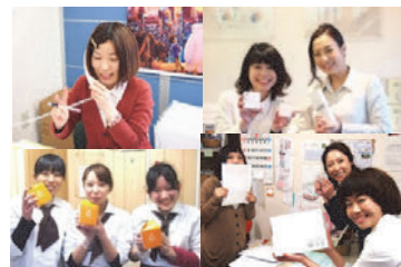
女性の活躍で温泉街を活性化