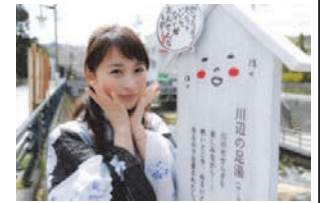
話しかけてくる看板