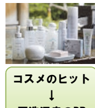
コスメのヒット ↓ 玉造温泉のPR