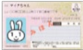
マイナンバーカード （電子証明書）