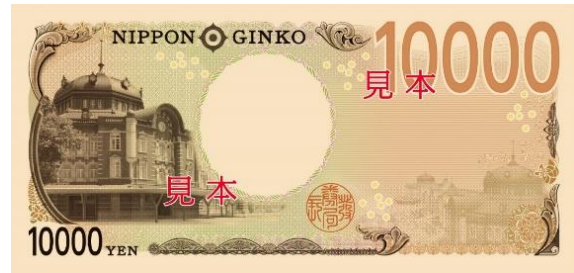
東京駅(丸の内駅舎)