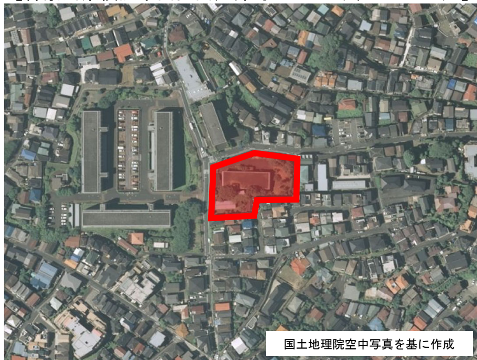
国土地理院空中写真を基に作成