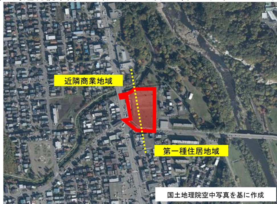
国土地理院空中写真を基に作成