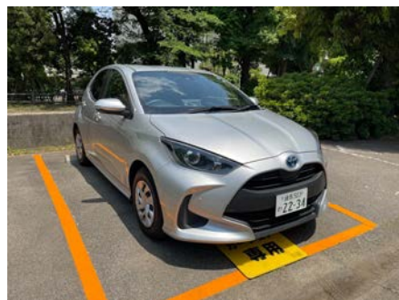
カーシェアリング / 西大久保第二住宅