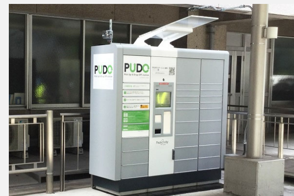
中央合同庁舎第3号館

上記に加え、災害対応力強化に資する可能性のあるモバイルバッテリーシェアや、子ども・子育て支援に資する施設(学童保育)等の導入を模索しているところ。