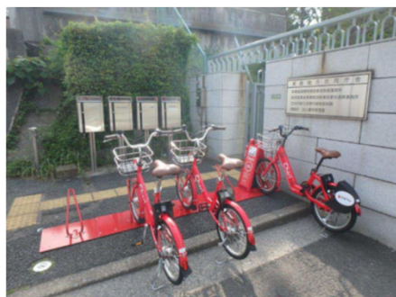
シェアサイクル / 湯島地方合同庁舎