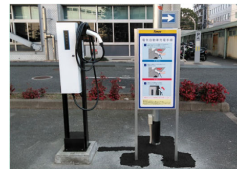
EV用充電器 / 福岡地方合同庁舎