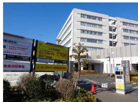
時間貸駐車場 / 立川地方合同庁舎