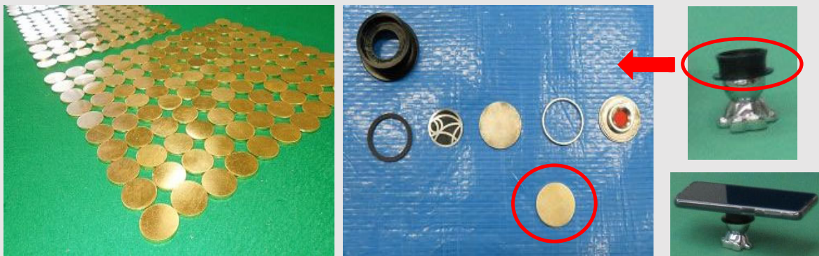
金地金の密輸形態別処分量数（平成29～令和3事務年度）

犯則者Bらが、中国から航空貨物（スマートフォンホルダー）により、金地金約7kgを税関長の許可を受けることなく輸入しようとし、消費税等約467万円を不正に免れようとした事案を告発しました。