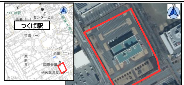
国土地理院淡色地図・空中写真を加工