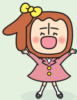
個人向け国債の個性ちゃん