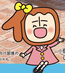
個人向け国債の 個人ちゃん